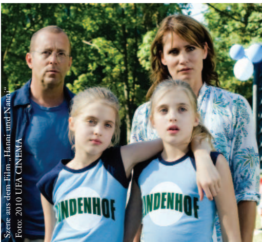
Szene aus dem Film „Hanni und Nanni“