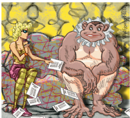
Illustration: Wolfgang Hüls