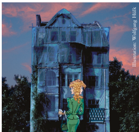
Illustration: Wolfgang Hütk