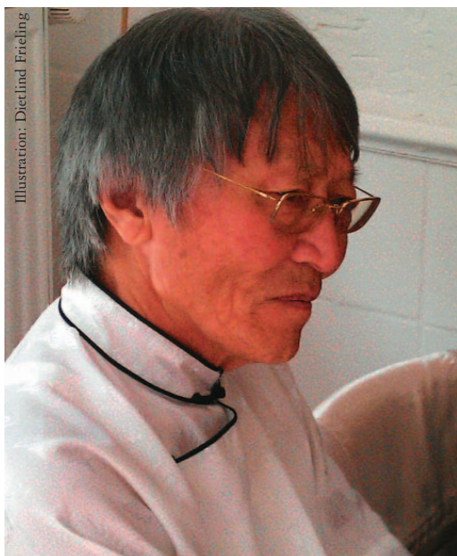
Illustration: Dietlind Frieling