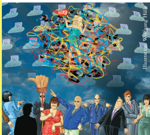
Illustration: Wolfgang Hülk