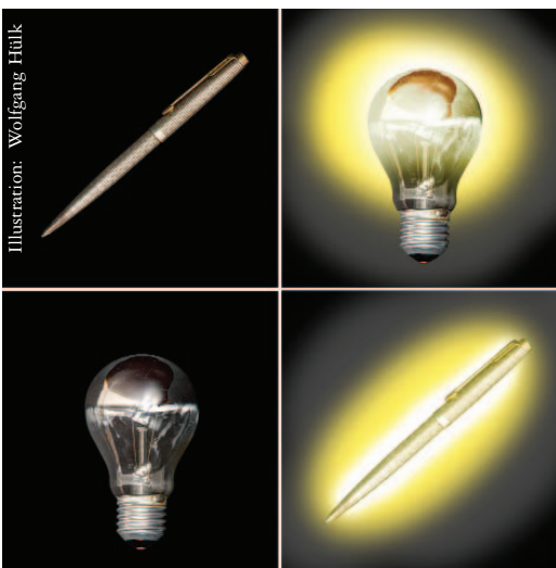
Illustration: Wolfgang Hülk