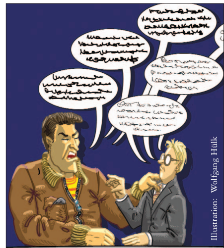
Illustration: Wolfgang Hütk