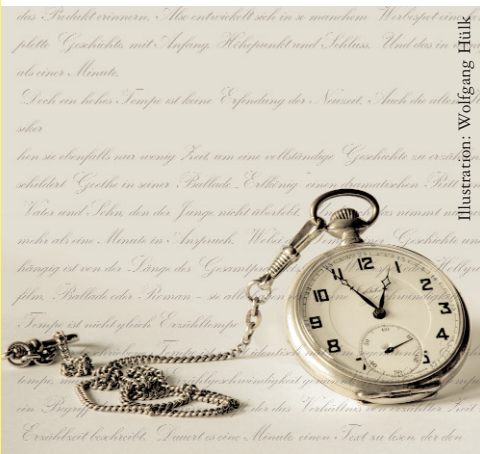
Illustration: Wolfgang Hülk