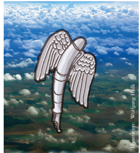
Illustration: Wolfgang Hülk