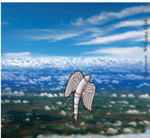
Illustration Wolfgang Hütk