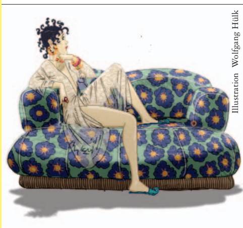
Illustration Wolfgang Hütk