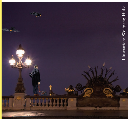
Illustration: Wolfgang Hülk